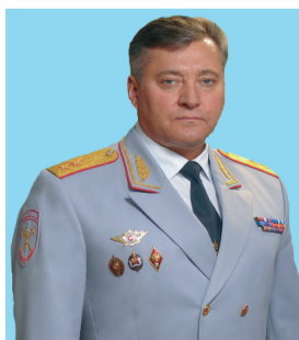
2 марта Скоков Михаил Иванович Председатель КФК №1, начальник ГУ МВД России по Челябинской области, генерал-лейтенант полиции