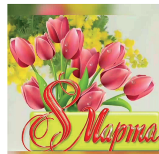
8 марта Международный женский день