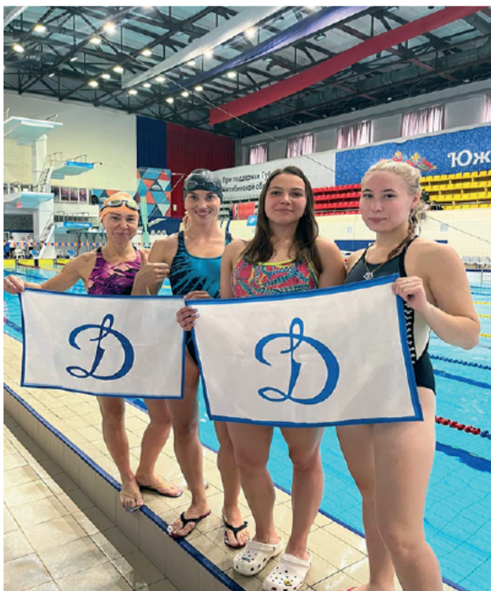
II этап турнира «Лиги Сильных» по плаванию прошёл в бассейне «Строитель» 8 сентября 2023 года.

Всего в мероприятии приняли участие более 50 участников: спортивные коллективы ЧВВА-КУШа, КФК, входящих в структуру ЧРО Общества «Динамо», - КФК №4, ГУ МЧС России по Челябинской области, Челябин-