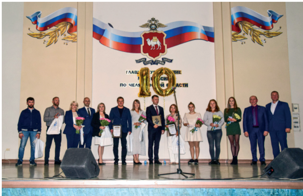
МБУ ДО СШОР "Динамо" г. Челябинска была создана 30 августа 2013 года.

В этом году она отметила своё 10-летие со дня образования. В школе занимается около 1500 воспитанников. Спортивная подготовка ведётся по 9 видам спорта: дзюдо, самбо, бокс, рукопашный бой, каратэ, тхэквондо, легкая атлетика, мини-футбол, смешанное боевое единоборство (ММА). В ознаменование 10-летнего юбилея СШОР «Динамо» в культурном Центре ГУ МВД России по Челябинской области состоялось торжественное собрание.