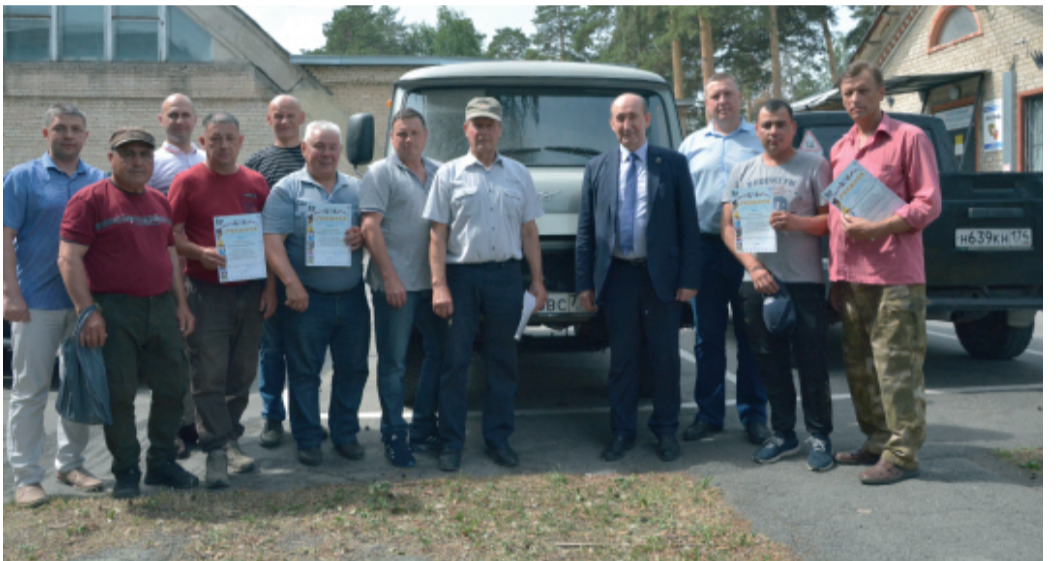
Завершилось торжественное мероприятие общими фотографиями на память.