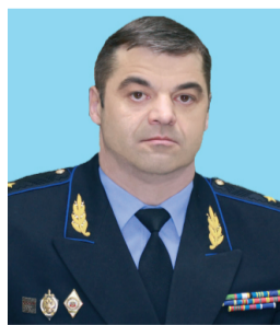
6 июня Тишин Дмитрий Станиславович Председатель КФК №4 начальник ПУ ФСБ России по Челябинской области генерал-майор